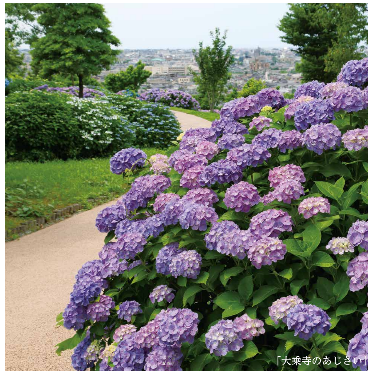
「大乘寺のあじさい」

事務局/金沢市大手町15番15号 金沢第2ビル4階 TEL:076-254-6368 FAX:076-254-6395 E-mail:office@kanazawa-north.jp HPアドレス:http://www.kanazawa-north.jp