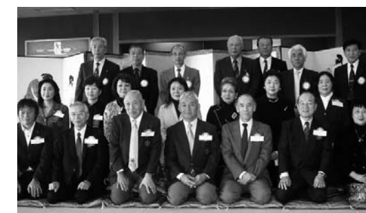
東京六本木RCの皆さん