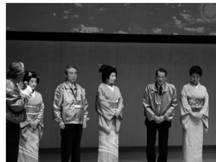
次年度ホスト・金沢RCの挨拶