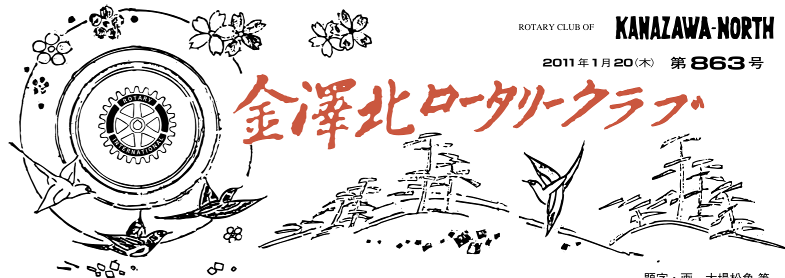
題字・画 大場松魚 筆