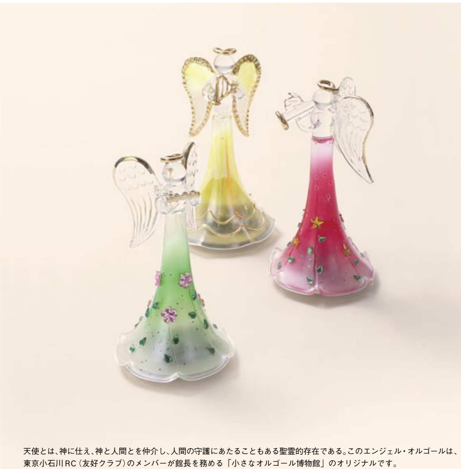
天使とは、神に仕え、神と人間とを仲介し、人間の守護にあたることもある聖靈的存在である。このエンジェル・オルゴールは、東京小石川RC(友好クラブ)のメンバーが館長を務める「小さなオルゴール博物館」のオリジナルです。