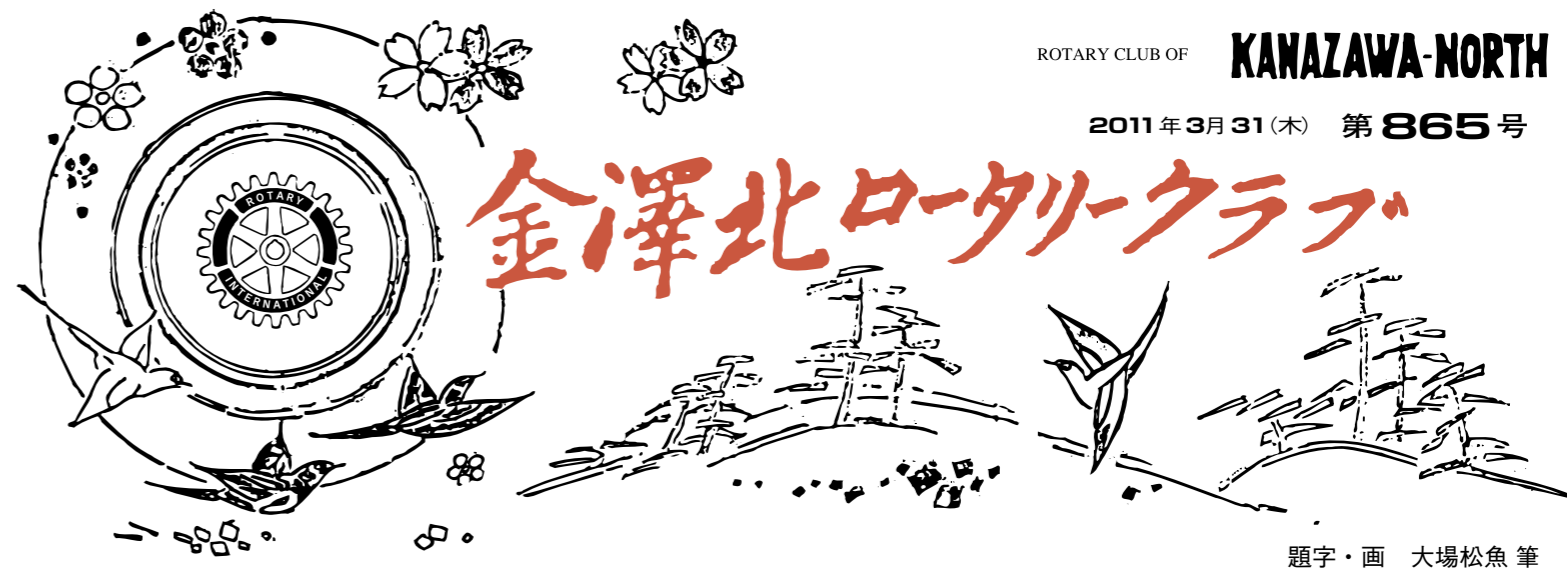
題字・画 大場松魚 筆