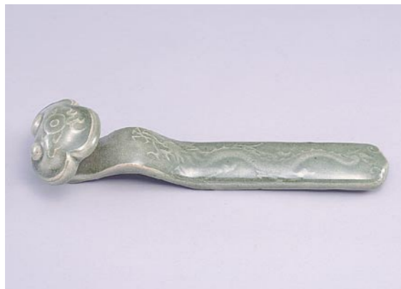
青磁如意 置物/青木木米 作(金沢卯辰山工芸工房 蔵品)

青木木米（1767～1833）は京都生まれの陶工・文人画家でした。木米という号は、生家である茶屋「木屋」の「木」と、幼名「八十八」を合わせた「米」から由来しています。