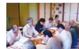
ガバナー補佐との クラブ協議会