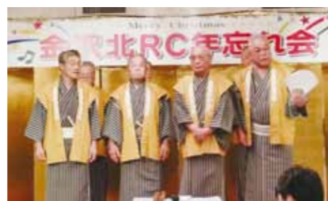
金沢相撲甚句会によるお祝儀