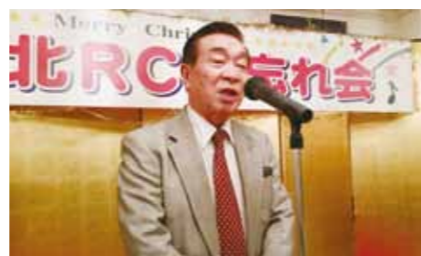
松本会長エレクト 閉会のご挨拶