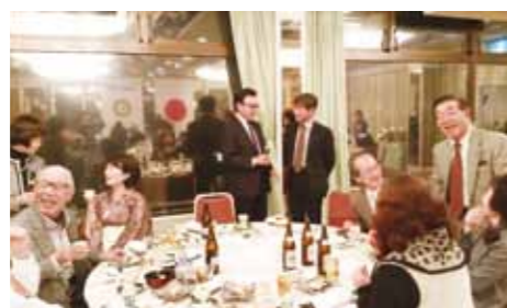
皆さん、満面の笑み♪