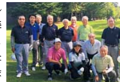
中軽井沢カントリークラブ

車で軽井沢に直行する3名を除く金沢北の参加者9名は、金沢駅に集合し、午前6時13分発「はくたか」に乗車、軽井沢に向かいました。軽井沢駅到着後ジャンボタクシーに揺られ、蕎麦畑と浅間山(好天でしたが快晴とまではいかず浅間山頂付近は雲で覆われていました)を眺めながら20分、中軽井沢カントリークラブに到着しました。スタートホール付近で、東京小石川の皆様と記念撮影をした後、各々、ラウンドを開始しました。初日はコンペではなく練習ラウンドということで、名門コースの景色と、ハーフ終了後のテラスでの食事(この時期の金沢だと暑くてテラスで昼食をとる気はしません)を楽しみながら、ゆったりとした時間を過ごしました。