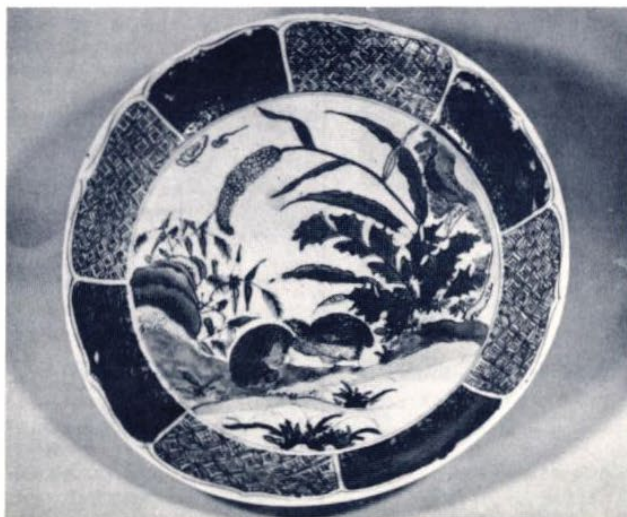
古九谷色絵鶉草花図平鉢