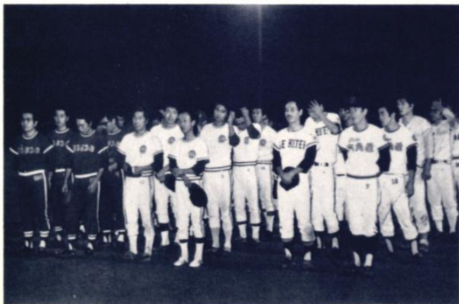
内灘球場に勢揃いした3強

最後になりましたが、試合中の怪我、その他不慮の事故をと思っていつも持ちまわっていた救急箱が遂に蓋を明け得なかったことが私のうれしかったことの一つであることを申し添えます。