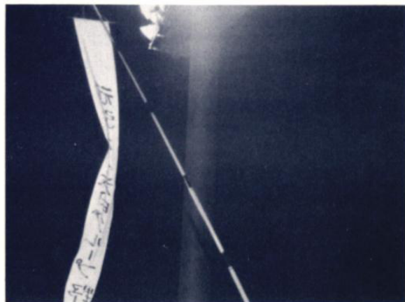
ガンバレわれらのチーム……………!!