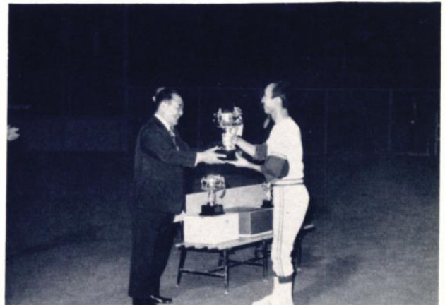
優勝チーム金沢シールへカップ