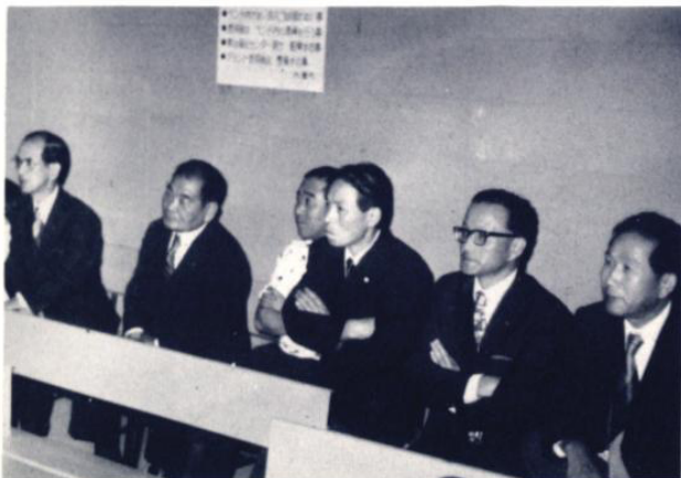
熱戦にかたずを飲む会員の観戦風景