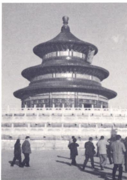
北京天壇公園にて、中国には、このような旧蹟、全殿玉楼が多くある。

道路は雄大に、天安門広場は50万人を、その付近の道路を含めて100万人の大集会が出来ると聞く。新・旧の大建築物が偉容を誇っているが、1959年に完成の北京駅をはじめ、人民大会堂、歴史、革命両博物館、工人体育館、放送局、北京飯店、民族飯店など、新中国の一面を表徴しているようである。