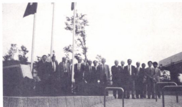
児童館前にて(ポールは当クラブ寄贈のもの)