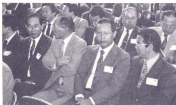
大会参加の金沢北RCの会員