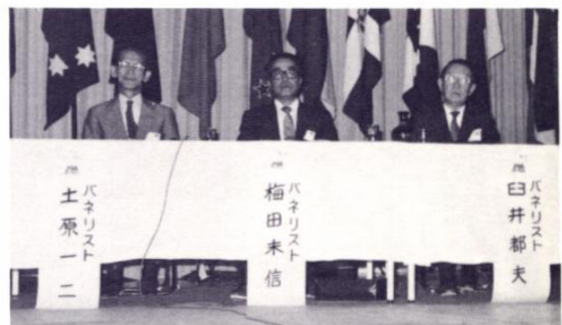
シンポジウムのパネリスト 土原会員