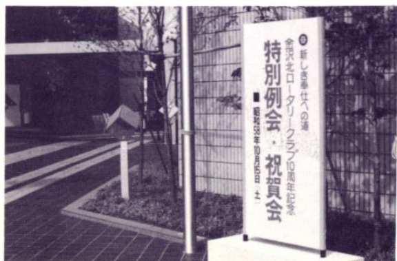
会場入口 金沢市文化ホール前