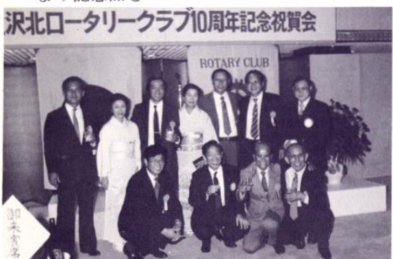
友好クラブ 京都洛北ロータリークラブと共に