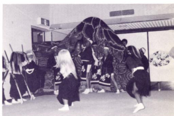
祝儀「加賀獅子舞」馬場校下加賀獅子舞保存会