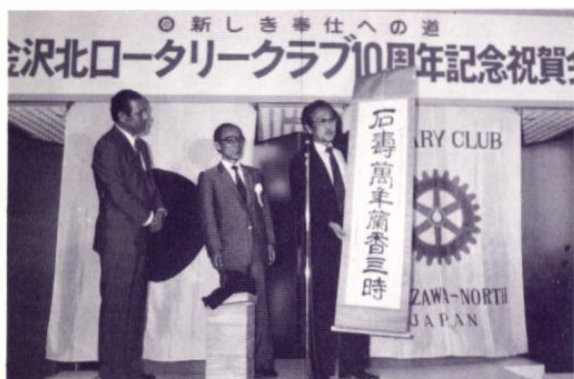
姉妹クラブ 韓国南光州ロータリークラブより記念品を