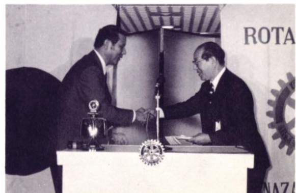
記念事業目録を江川市長へ