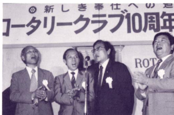
南光州のメンバーが唄う