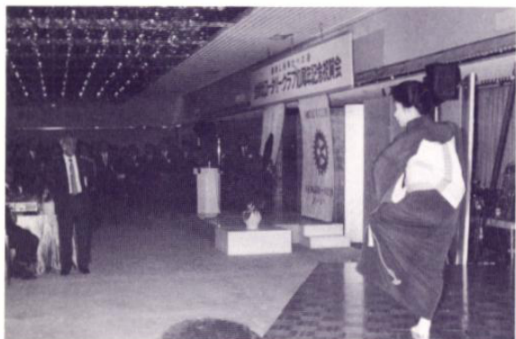
祝儀 小唄振り「加賀鳶」