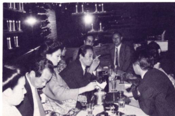
二次会 ムーンライトにて