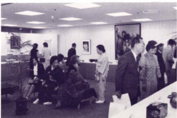
記念美術展（会員とその一門）