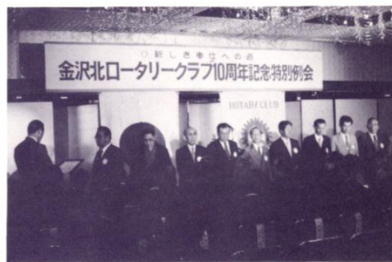
歴代会長・幹事表彰