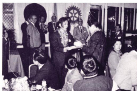
ラッキープレゼント