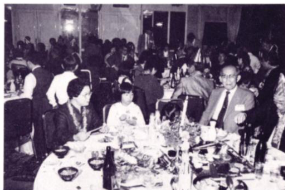
145名の参加者で会場は一杯