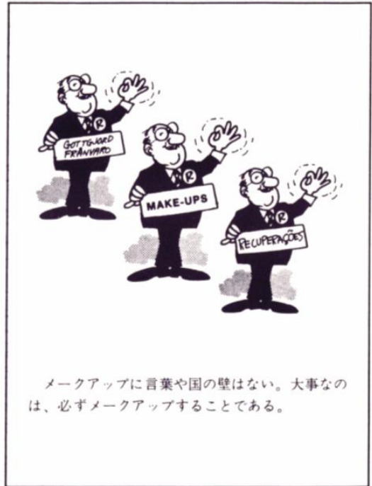
メイクアップに言葉や国の壁はない。大事なのは、必ずメイクアップすることである。