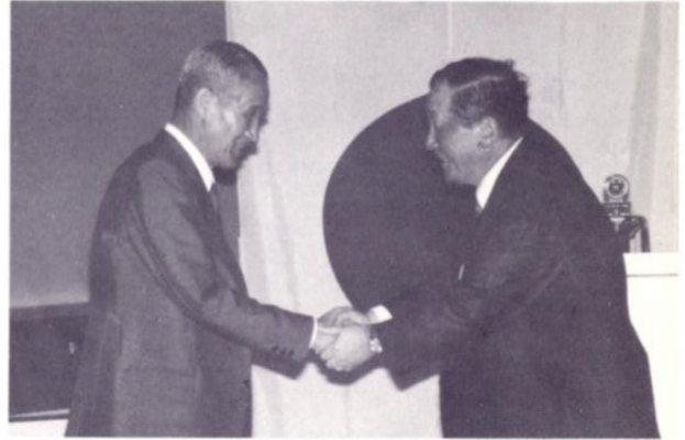
6月29日(土) 金沢5RC合同ゴルフ大会 片山津ゴルフクラブにて