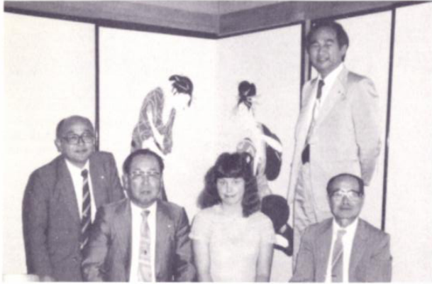
6月27日(木) 金沢北RCゴルフコンペ 片山津ゴルフクラブにて