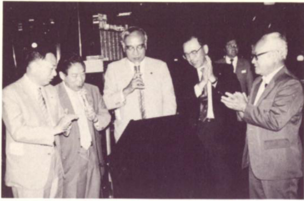
久しぶりの二次会でハッスルの大正組