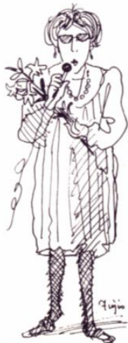
吉田富士夫会員画