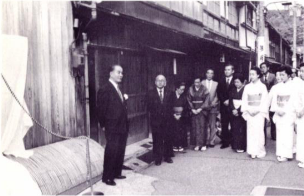
卯辰山東山地区観光案内板除幕式