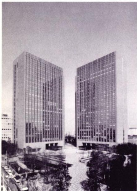
東京住友ツインビル西館—写真左側— が住友海上本店ビルです。

損害保険は「1人は万人のために、万人は1人のために」という相互扶助の精神に基づいて、お客様に安心と安全をお届けする使命を担っています。この社会的使用を果していくために「信用を重んじ確実を旨とし進取を尊ぶ」という住友グループの伝統的事業精神をバックボーンとして経営に当たっております。業界をとりまく社会経済環境は個人生活の多様化・成熟化に伴うセキュリティー