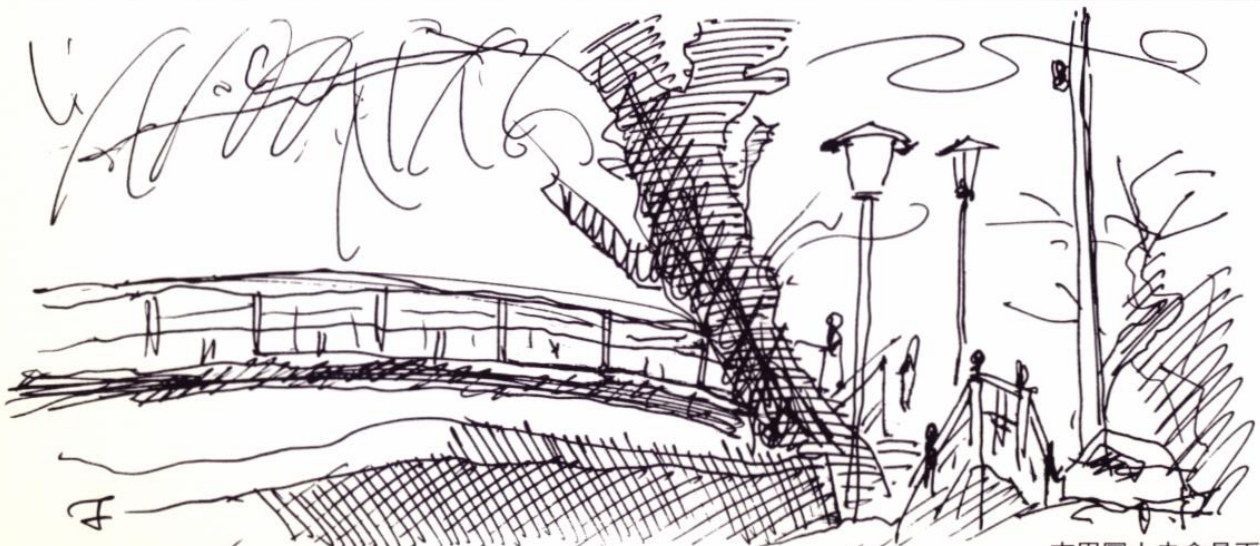
吉田富士夫会員画