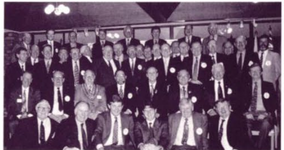
④これは7月にあったChmgeover Nightの日である。何人かはグラスゴ(イギリス)のconventionからまだ帰って来ていなかっただったのでメンバー全員ではないのだけれども、これがHamiltonロータリークラブのメンバーです。