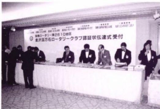
受付を手伝う・金沢北RC会員