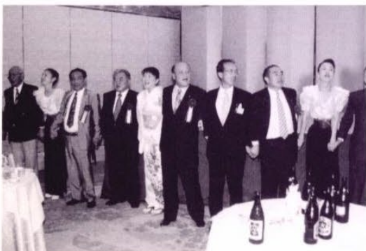
友情の輪・手に手つないで

しかしながら、これらの障害を一つずつ克服し何とか船出を実行出来ましたことをサポートクラブと共に慶びたいと思っています。