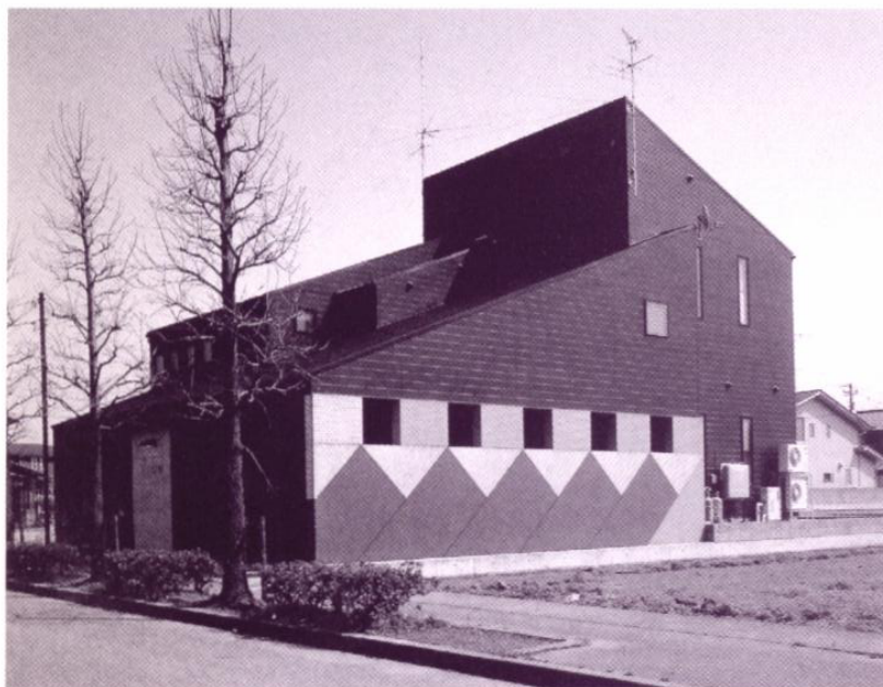
▲I氏邸 (INAXデザインコンテスト優秀賞受賞・全国コンテスト)

新しい材料(スチール・コンクリートetc)と日本国産の木(北山天然杉丸太末口300φetc)の素材の組み合わせにより、居住空間に新鮮さ(古典~現代)を取り入れる。3次元的デザインとしては、目で見ても(視覚的機能性として)面の構成の中で建築材料・建築構造の変化に伴い軽やかでリズムカルな表現とした。