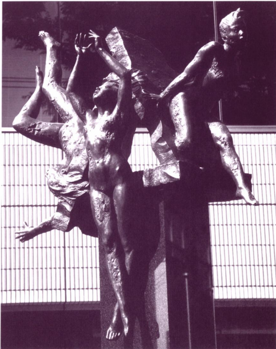
題名：WALL - 壁 県供給公社(幸町交差点)