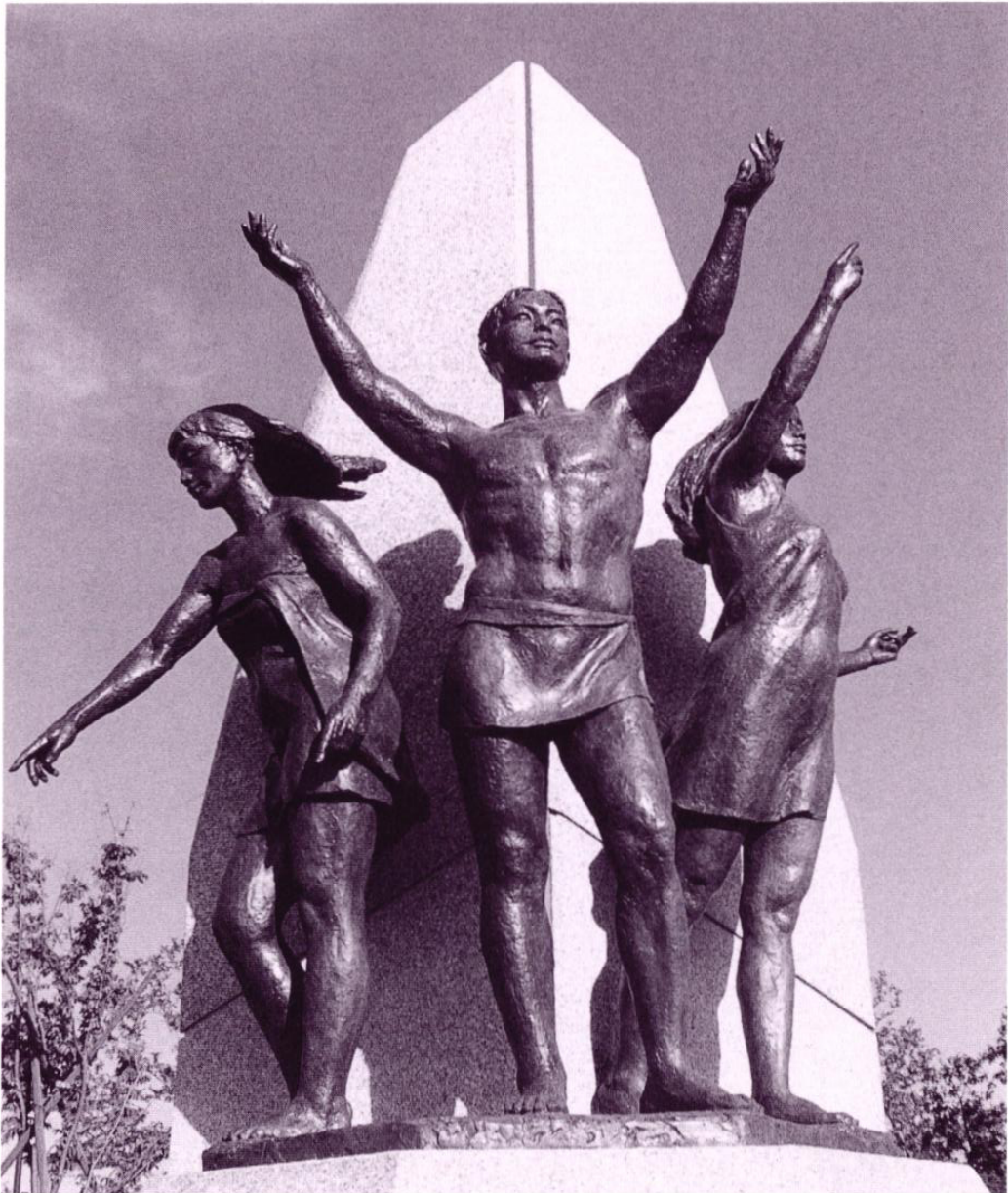
平和都市宣言像 内灘町