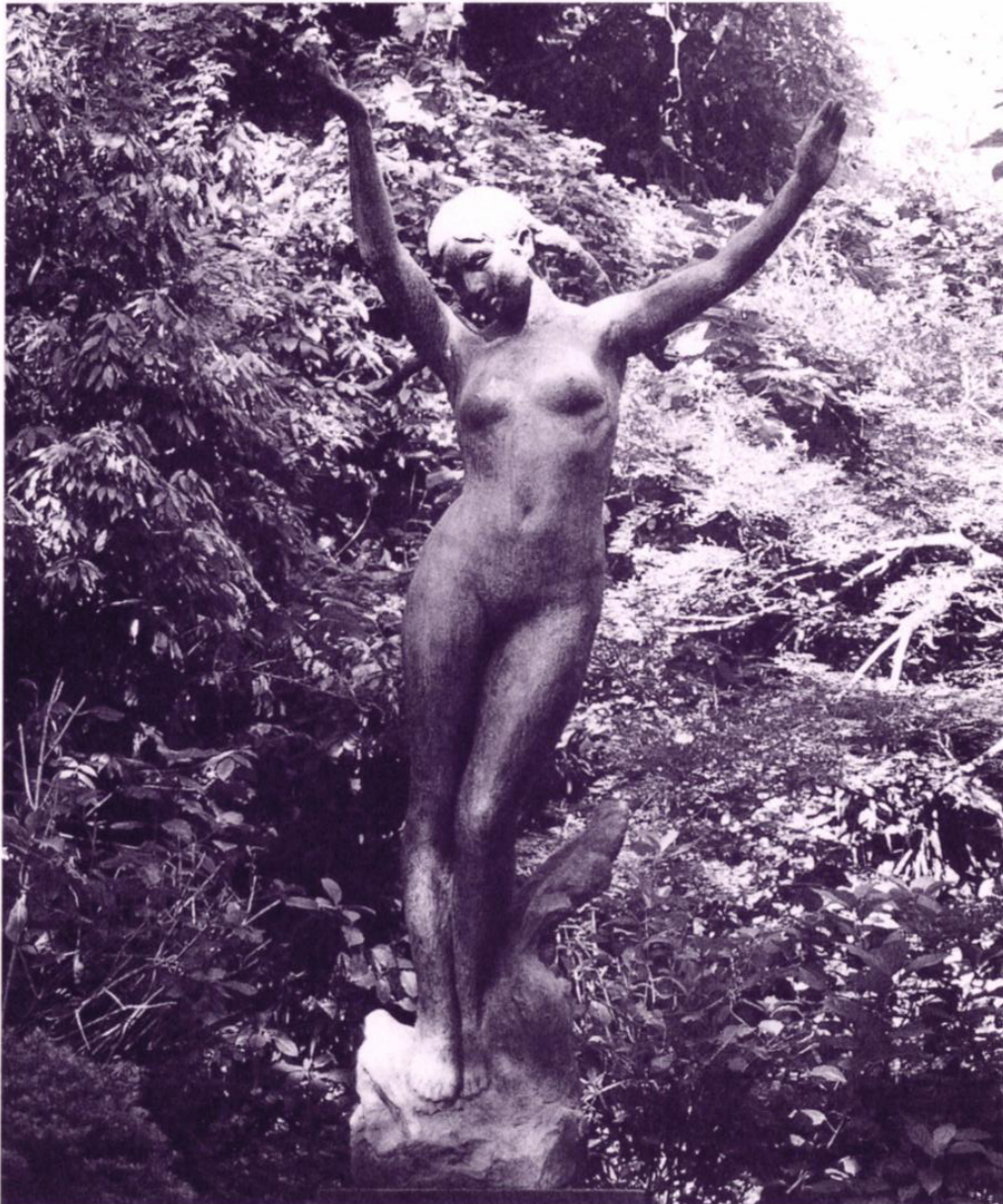
題名：愛の十字架 白鳥路公園