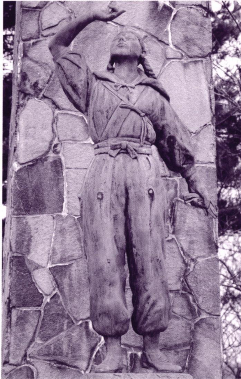
題名：殉難女子挺身隊員世界平和祈願像 奥卯辰山公園