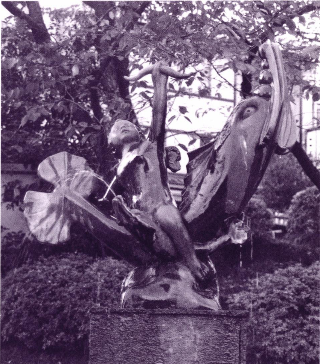
題名：イルカに乗った少年 兼六園下バス停横