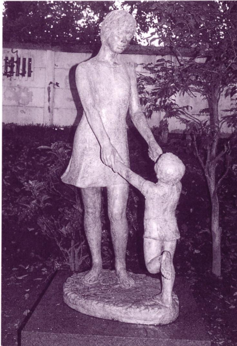
「小さな願い」 白鳥路