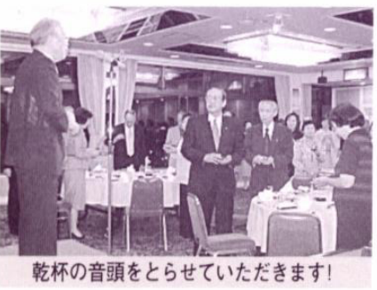
乾杯の音頭をとらせていただきます!