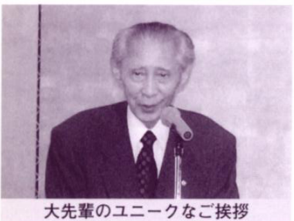
大先輩のユニークなお挨拶