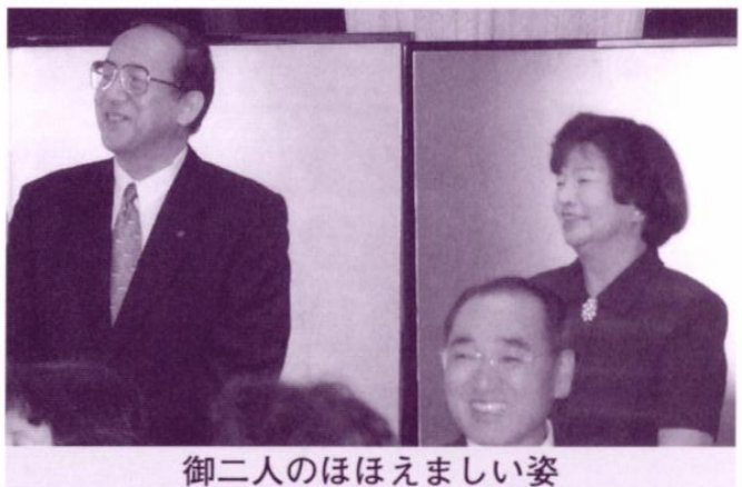
御二人のほほえましい姿