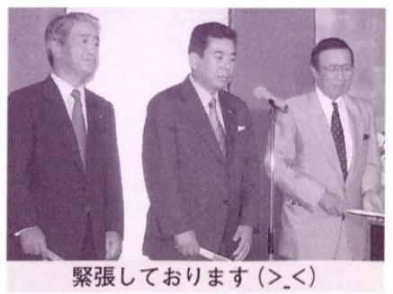
緊張しております (>_<)