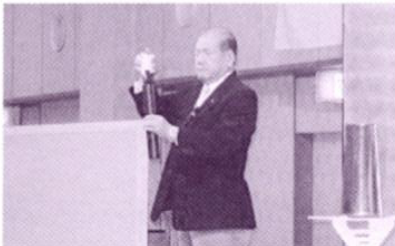
マジシャン高島会員による手品