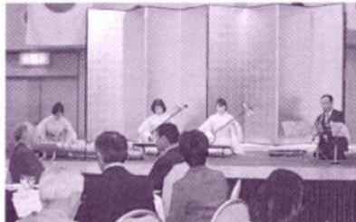
尺八と琴と三味線の三重奏