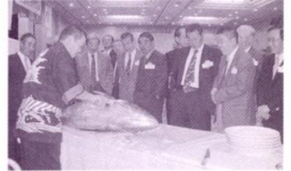
豪快な！本くろまぐろの解体