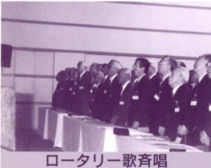
ロータリー歌斉唱