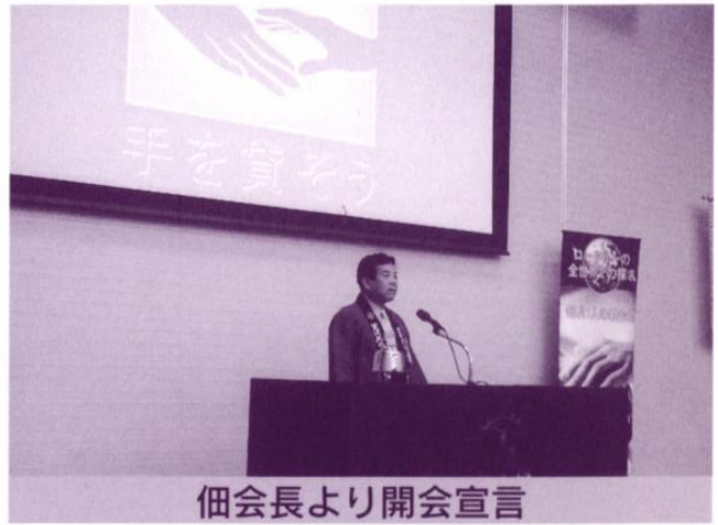
佃会長より開会宣言