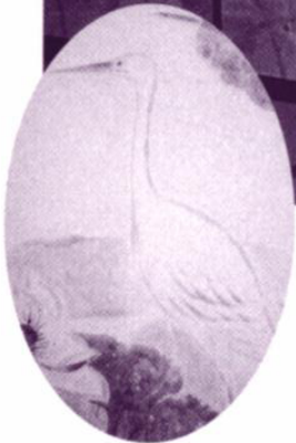
二塚 長生氏画「連池白鷺図」(れんちしらさぎず) 月心寺本堂・裏千家及び茶道・隆茗会御霊屋襖絵