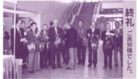
終礼 ご苦労様でした。