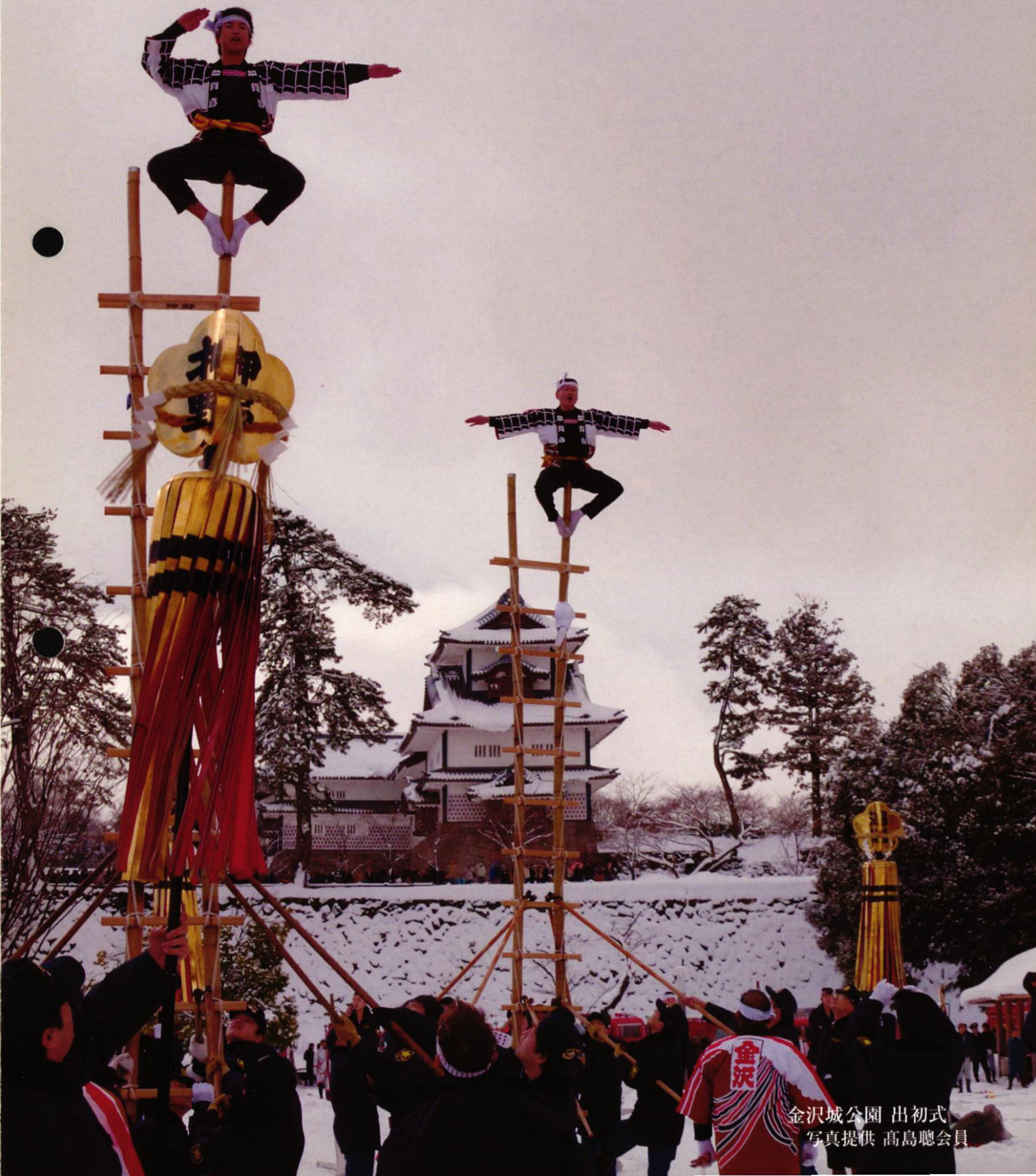
金沢城公園 出初式