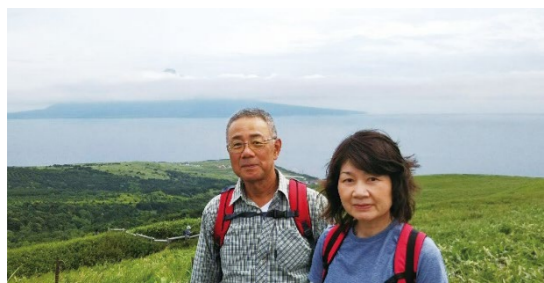
礼文島からの利尻富士

その後は新型コロナウイルス感染拡大防止により、県外への旅行が自粛要請されて、ここ2年間は取止めてしていました。今年こそは再開して、登山旅行に出かけたいと思います。安全と健康を祈念して、歩くことができる事に感謝します。